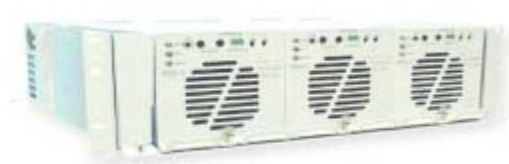
CSM11 24V to 48V